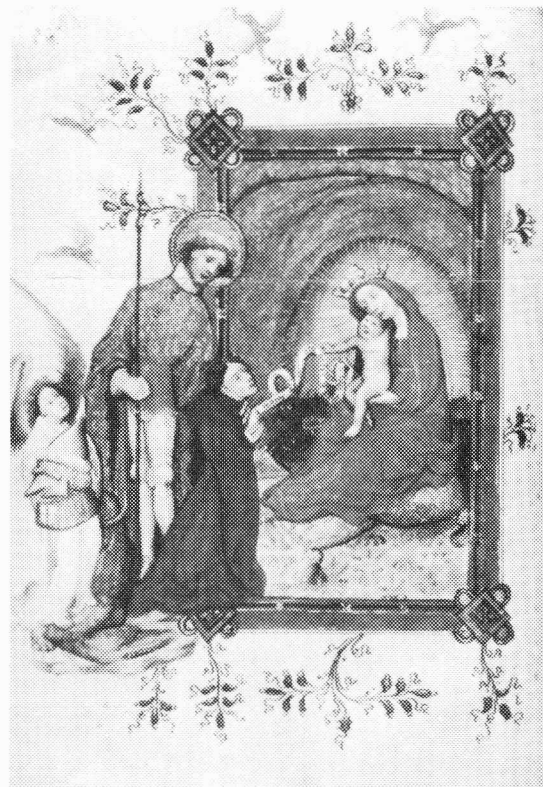
Madonna met opdrachtgever en St Joris in Pre-Eyckiaans getijdenboek. Rouen, Bibliothèque de la Ville, Ms. 3024, fol. 12v. Te zien in LEUVEN.

DEN HAAG Rijksmuseum Meermann-Westreenianum: Teken van de tijd. Maand- en seizoensvoorstellingen van de Middeleeuwen tot 1800. 13 augustus - 16 oktober 1993. Geen catalogus, wel een verjaarskalender met toelichtingen