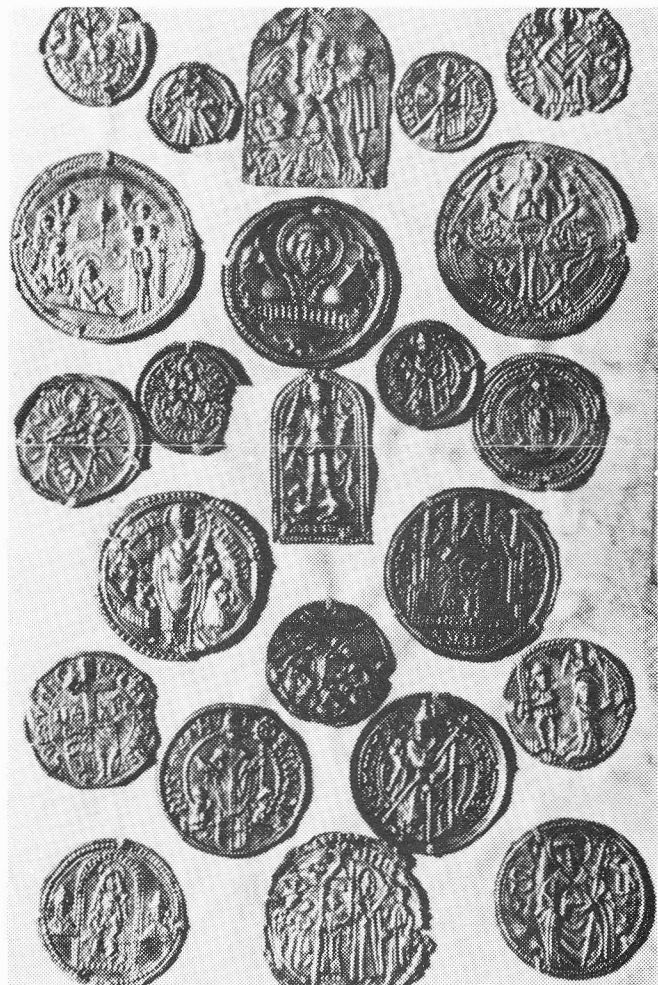
Pelgrimstekens en insignes, rond 1500 ingenaaid in een getijdenboek (Brugge, tweede kwart 15de eeuw). Den Haag, Koninklijke Bibliotheek. Te zien in ROTTERDAM.

Sedert 1986 verschijnen met zekere regelmaat facsimiles van verlichte handschriften, vroege drukken en met de hand geproduceerde kaarten. Evenals bij ander uitgever is er telkens een commentaar van de hand van een specialist, maar opmerkelijk is het medium van de facsimile zelf: microfiches. De kwaliteit van scherpte en de kleuren is uitstekend; de prijsstelling is tegenover gedrukte facsimiles bijzonder gunstig (veelal tussen 500 en 700 DM). Tot dusver verschenen in diverse reeksen ruim 35 delen. Voor een uitgebreider overzicht kan men zich tot de uitgeefster wenden: Edition Helga Lengenfelder, Schönstrasse 51, D-81543 München (tel. +49.89.663845).